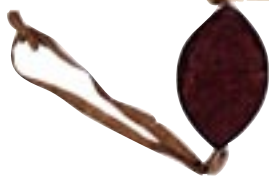
Diplôme de médecine. Sceau de l'université de Montpellier 1618