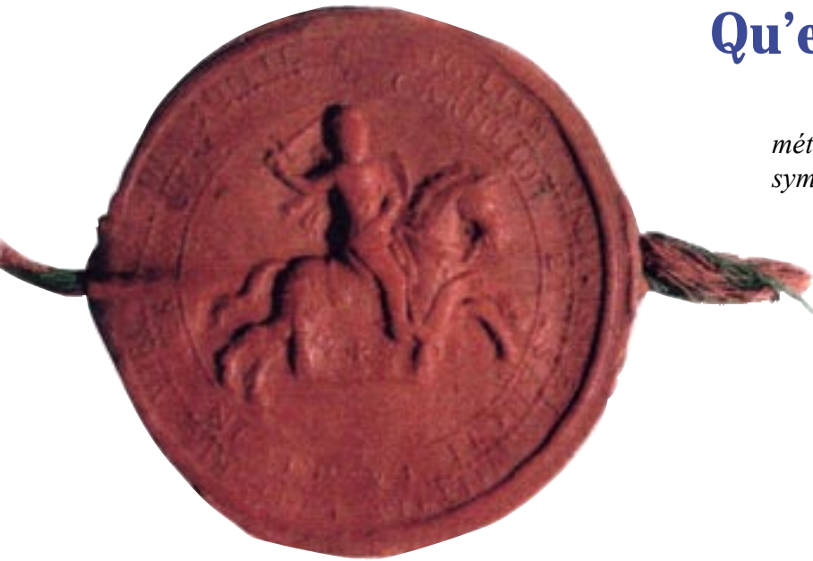
Sceau du grand maître de l'ordre militaire et hospitalier de Notre-Dame-du-Mont-Carmel et de Saint-Lazare-de-Jérusalem 1784

Un sceau est une galette de cire ou de métal portant l'effigie ou la représentation symbolique d'une personne.