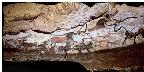
Fresques à Lascaux