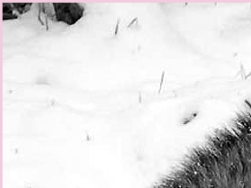
« Extase » - 6,50 x 3,40 m

En Dordogne, l'Espace Culturel François Mitterrand du Conseil général de la Dordogne à Périgueux, à Argenton-sur-Creuse « l'Arboretum » lieu d'art contemporain et la Galerie Charlotte Norberg à Paris vont accueillir simultanément, du 1 er février au 30 mars